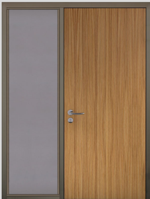
Seitenteil mit verdeckt liegenden Band