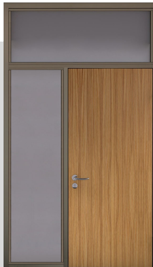
Oberlicht-/Seitenteil mit verdeckt liegenden Band