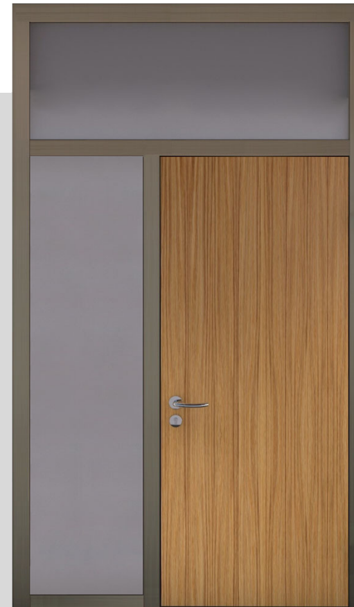
Oberlicht-/Seitenteil mit VX-Band