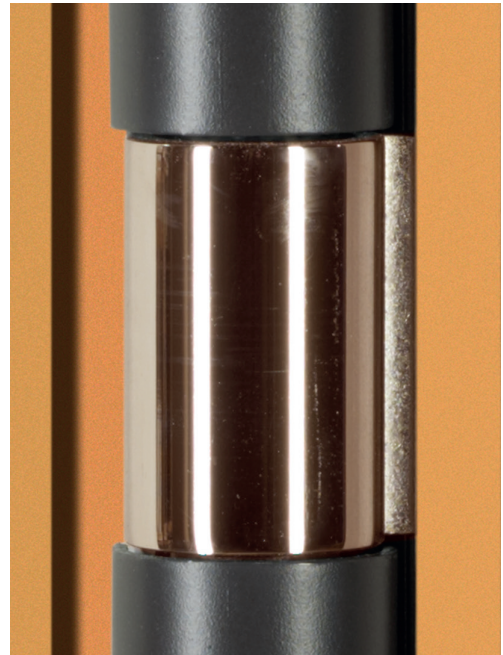
Runder Zargenspiegel und runde Bänder reduzieren die Verletzungsgefahr durch die Türen. Bild 47c91343

Für die Türen lieferte BOS Best Of Steel die Fingerklemmschutz-zargen "SafetyDesign" – Türrahmen für höchste Sicherheitsansprüche mit ansprechender Optik, die speziell für den Einsatz in Kindergärten, Kindertagesstätten und Schulen entwickelt wurden. Durch die runde Form des Spiegels und des Bandes wird ein Einklemmen der Finger an der Bandseite vermieden. Der Türdrehpunkt ist mittig vom Spiegelradius und der gleichbleibende Abstand reduziert die Gefahr von ernsthaften Verletzungen. Für mehr Sicherheit im Falzbereich sorgt eine überhöhte Dichtung. Diese gewährt im Falle einer eingeklemmten Hand mehr Platz zwischen Falz und Türblatt und reduziert somit ebenfalls das Verletzungsrisiko.