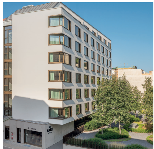
Hotel the YARD in Berlin-Kreuzberg. Bild E_47c01633