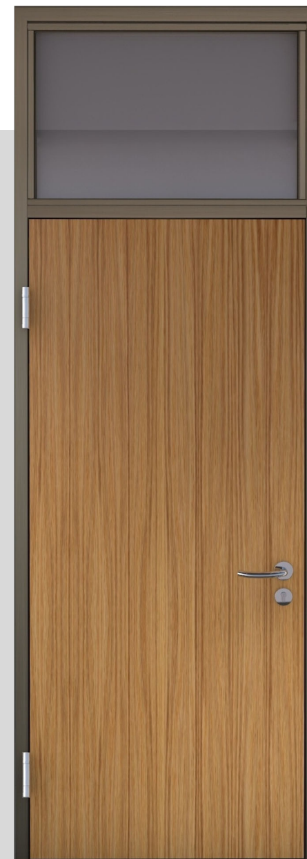
Oberlicht mit Rohrglasleisten