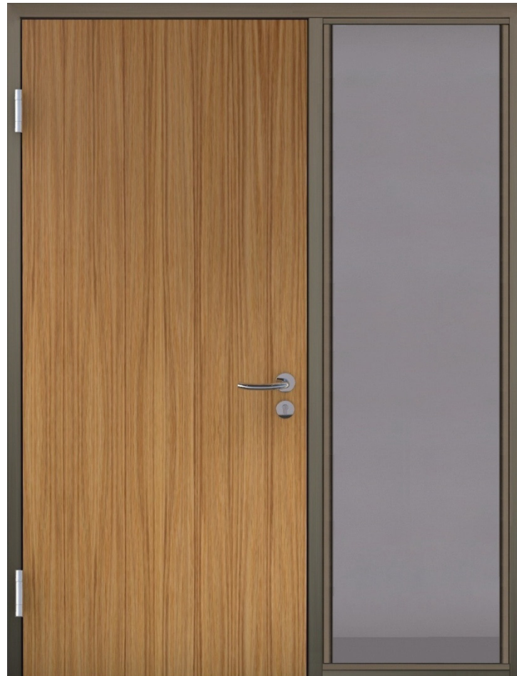
Seitenteil mit VX-Band

Alle Darstellungen mit Rohrglasleisten (Standard, stumpf gestoßen)